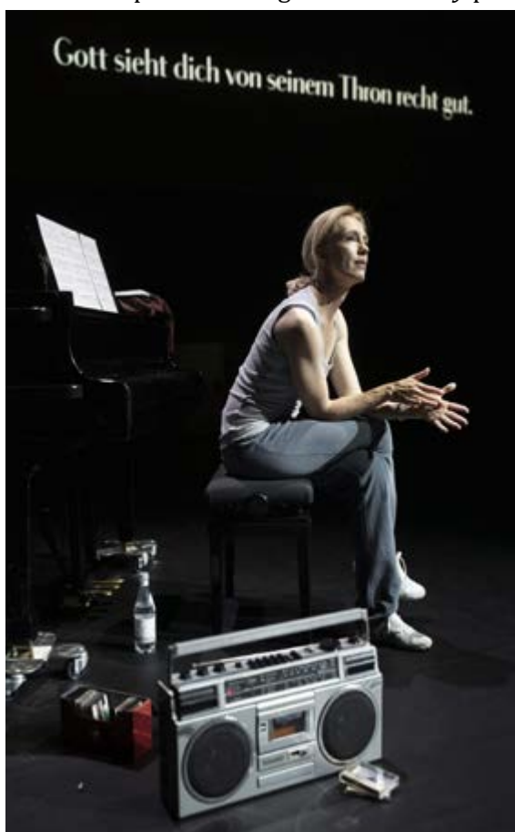
Everywoman , directed by Milo Rau, 2021.

Il proscenio pressoché nudo, eccezione fatta per le sedute laterali degli attori a destra e la postazione della violoncelli-