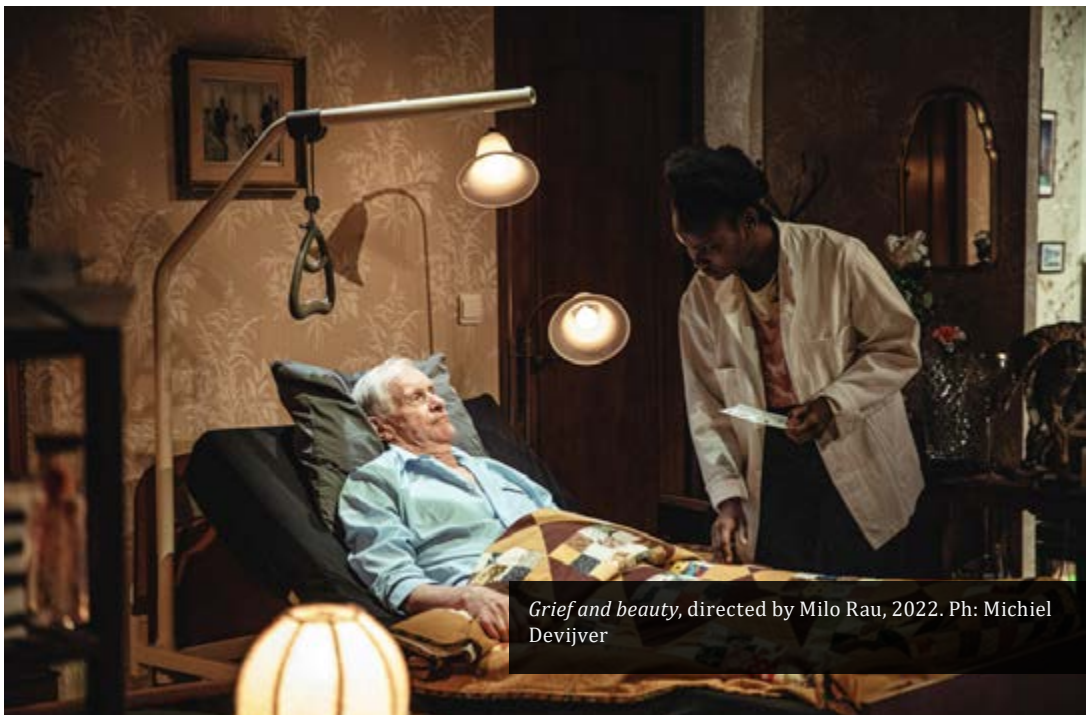
Grief and beauty , directed by Milo Rau, 2022.

Quello che procede da questo momento fino alla fine è una composizione che utilizza tutti gli elementi del teatro postdrammatico, ma con esiti opposti. I titoli, il monologo, l'intervista, la poliglossia, il documento d'archivio, l'intermedialità sono parte di una composizione sinestetica che interseca le storie dei quattro personaggi/persone per raccontarci con il loro esempio che in maniera inequivocabile le vite di tutti si somigliano. Non c'è una rottura del linguaggio che mostri l'incomunicabilità o l'assenza di significato. Al contrario, usando l'affermazione come metodo artisti-