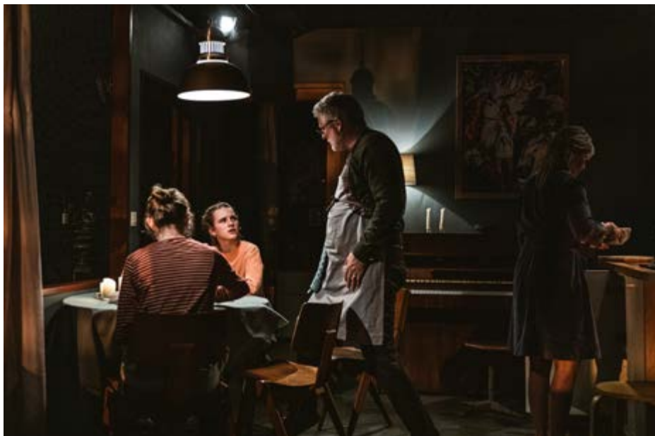
Family , directed by Milo Rau, 2020.

Ciò che accade da qui in poi è il succedersi di azioni di per sé banali. In un alternarsi tra scene familiari e resoconto dei risultati dell'attività investigativa sulla famiglia Demeester, lo spettacolo si dipana per un'ora e quaranta minuti. La madre farà una doccia, il padre continuerà a cucinare, la sorella a imparare le frasi in inglese aiutata da Louise che, dopo aver esposto l'antefatto, entra dentro la villetta e prende posto sul letto accanto a Leonce. La famiglia Miller-Peters andrà a cena e non sarà una serata diversa dalle altre. Eccetto per un riferimento di Louise alla morte. Lo spunto è il racconto di un evento che coinvolge alcuni suoi coetanei e delle immagini scabrose che, da private, sono diventate pubbliche. «Dopo stanotte non ci sarà più niente di cui preoccuparsi», dirà la figlia maggiore apostrofando il padre. Il potere intrinseco di influenza dell'immagine sulla vita contemporanea (tema caro a Rau) è qui esposto come sottotesto implicito.