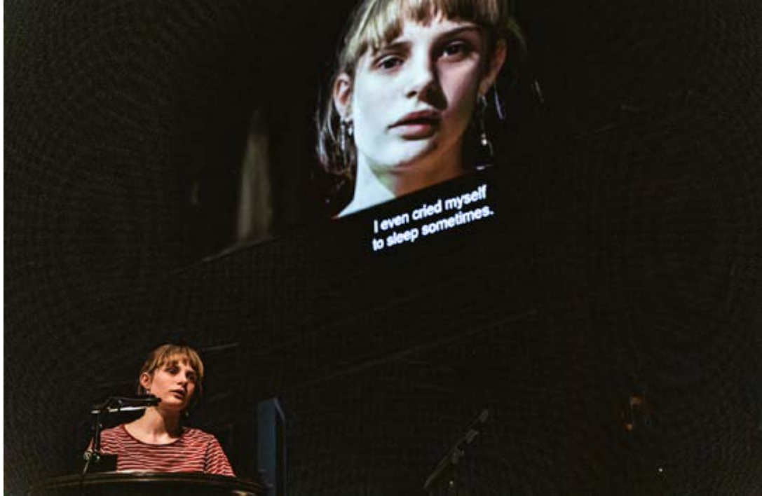
Familie , directed by Milo Rau, 2020.

– la casa vuota in penombra e il cinguettio degli uccelli – sarà l’ultima che vedremo. Parafrasando l’estetica scenica, potremmo dire che l’ambiente ci sopravviverebbe se gli lasciassimo spazio.