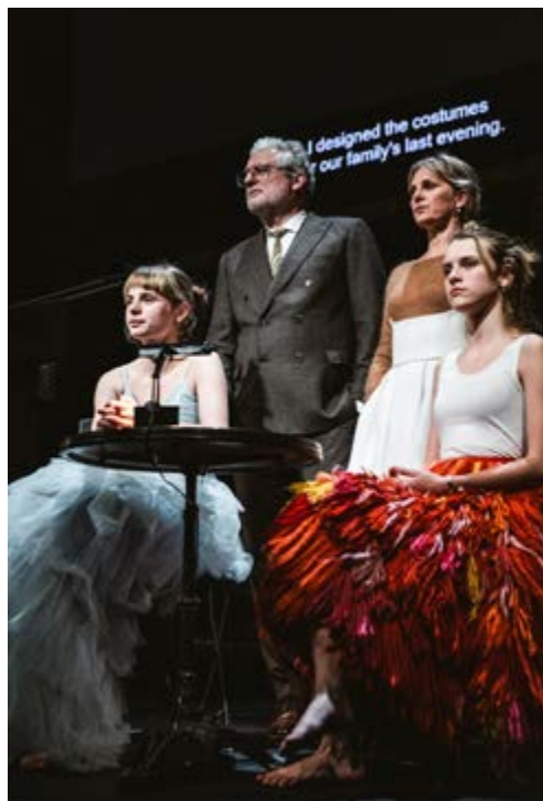
Familie , directed by Milo Rau, 2020

Gli attori entrano in scena alla spicciolata, mentre in diffusione acustica udiamo le loro voci dirci, in forma di lista, le cose che amano fare. Quello dell’elenco è un espediente drammaturgico caro al teatro postdrammatico, riutilizzato qui in forma di prologo (il quale con l’antefatto e l’uso dei titoli rappresenta l’insieme degli elementi stranianti precipui del teatro epico brechtiano) 33 e che Rau riutilizza a proprio modo. Una seconda lista sarà letta dalla madre a conclusione dell’attività di smantellamento che il nucleo familiare opera in casa, trasportando fuori, dentro degli scatoloni predisposti in proscenio, tutti gli oggetti che in essa erano contenuti, svuotandola, lasciandola libera dai propri effetti personali, dai propri oggetti di consumo. An controllerà, allora, prima dell’impiccagione, spuntando da un foglio gli elementi piano richiesti, che Filip, il padre, ab-