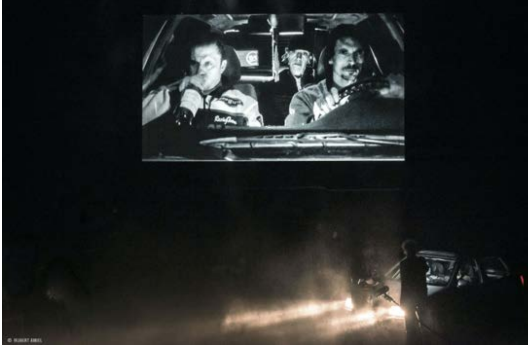
The repetition/La Reprise, directed by Milo Rau, 2018.

che presentiamo contestualmente a questo scritto, ha tra i suoi mentori, oltre a figure afferenti al nucleo familiare (il nonno) che lo hanno inserito in un ambiente culturale fertile e stimolante, Pierre Bourdieu. È noto che sia stato allievo di Todorov, ed è interessante anche la vicinanza con Bruno Latour, recentemente scomparso, ricordato nella stessa intervista, con cui si può intessere più di un rimando ideologico in merito alla sua pratica scenica. Appare non privo di riverberi per la poetica di Rau, infatti, non solo il concetto di agency introdotto dallo studioso francese («la radice comune dell'agency, questa "zona metamorfica" dove siamo capaci di individuare gli agenti prima che questi diventino attori, dove le "metafore" precedono le due serie di connotazioni che saranno collegate, dove la "metamorfosi" è vista come un fenomeno antecedente a tutte le forme che verranno date agli agenti»), 17 ma soprattutto l'idea di una dimensione ecologica dello studio e della ricerca che rende interdisciplinare il pensiero e, quindi, l'agire. E ancora, è interessante, a fronte della prassi di costruzione scenica dell'artista svizzero, il superamento speculativo proposto da Latour dell'antica dicotomia tra umano e non umano, così come tra scienza e natura, oltre che l'intenzione di pensare per 'zone metamorfiche'.